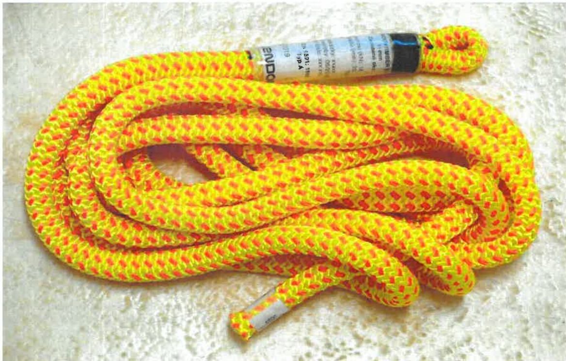
„TENDON TIMBER EVO 11 mm se zapleteným okem, typ Statické lano“ “TENDON TIMBER EVO 11 mm with spliced eye, type Static rope”